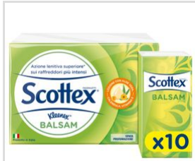
View: Online Optimized Image